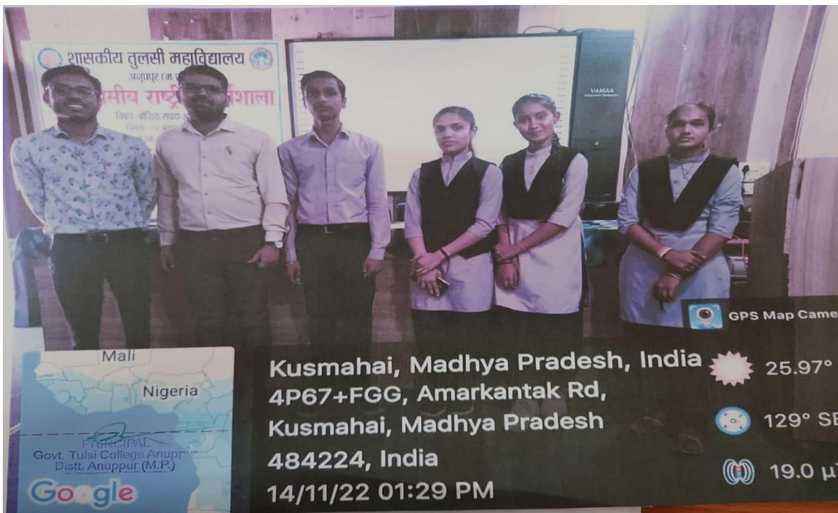
CS Scanned with CamScanner

Jaithari Road Anuppur, District- Anuppur, Madhya Pradesh, Pin Code:- 484224 www.gtcanuppur.ac.in