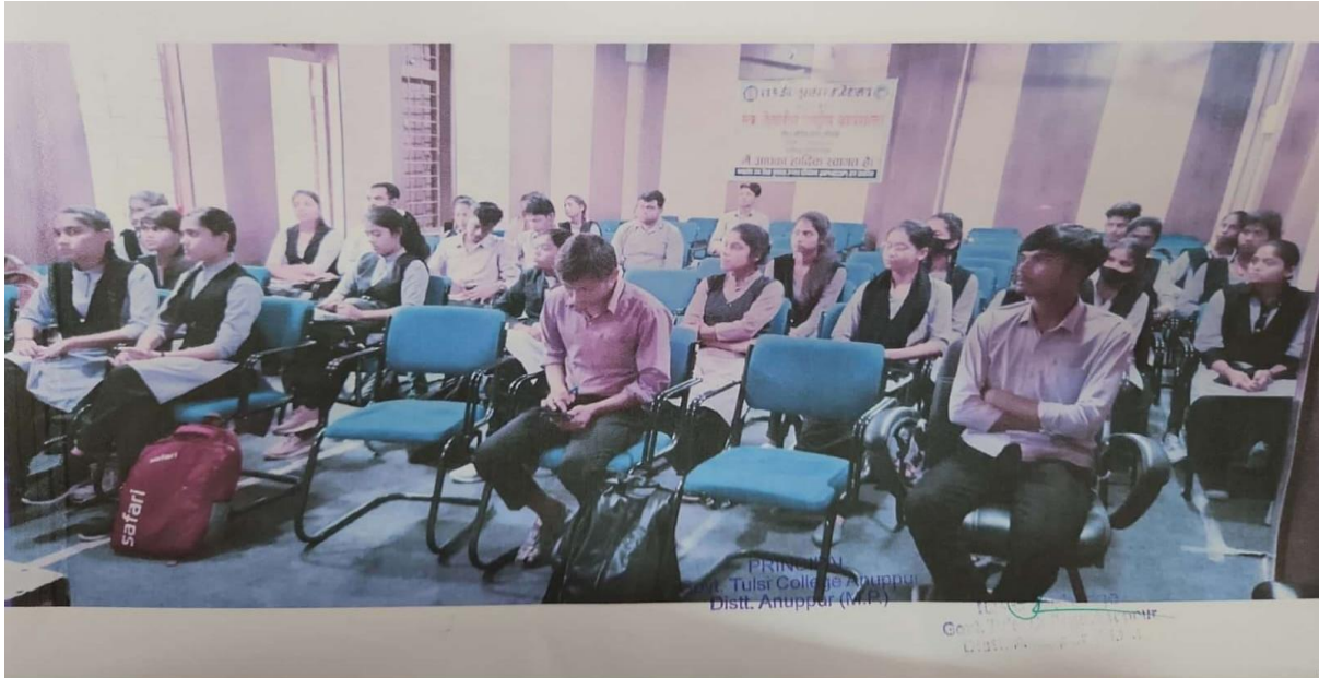
CS Scanned with CamScanner